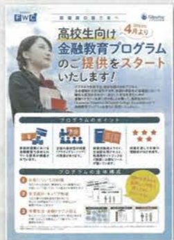
高校生向け金融教育プログラム(約50分)

激変する時代に備えるために必要なマネー知識。変化への対応、安心への備えに向けて、健康保険制度等の最新動向、相続・贈与や資産運用の基礎知識等について説明します。