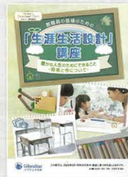
生涯生活設計講座 (約1時間)

老後収入の柱となる公的年金。その仕組みや給付内容、その他少子高齢化が進む中での今後の課題などを説明します。