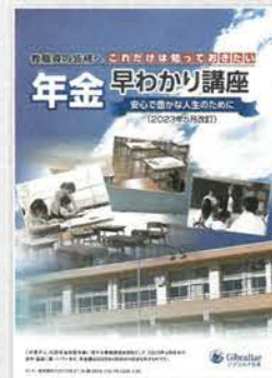
年金早わかり講座 (30分～40分)

老後収入の柱となる公的年金。その仕組みや給付内容、その他少子高齢化が進む中での今後の課題などを説明します。