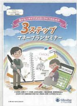
3ステップマネープランセミナー(約90分)

老後の主な収入となる公的年金制度の仕組みや給付内容等の説明。資産作り・運用で気をつけるべき事の説明や退職後のリスク等について説明します。