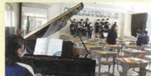
音程・リズムを確認しながらパート練習