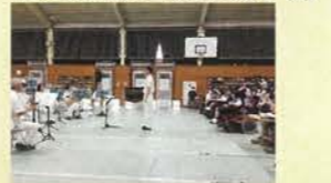
岐阜県警察音楽隊とのコラボ音楽会