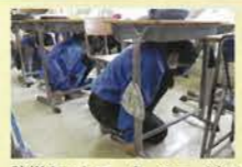
防災ネットワーク シェイクハンド