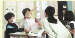
「ジャンプの課題」を設定した授業