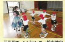
元世界チャンピオンの一輪車教室