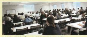
NPO法人 ひまわりの花