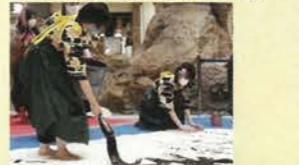
ショッピングモールでの書道パフォーマンス