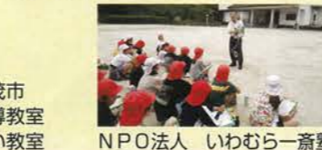
NPO法人 いわむら一斎塾