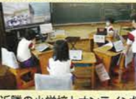
近隣の小学校とオンライン授業