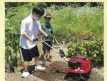
美濃加茂市 適応指導教室 あじさい教室