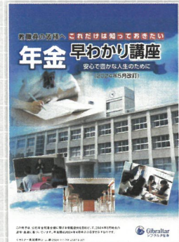
年金早わかり講座 (30分～40分)

老後収入の柱となる公的年金。その仕組みや給付内容、その他少子高齢化が進む中での今後の問題点などを説明します。