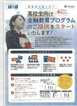
高校生向け金融教育プログラム(約50分)

激変する時代に備えるために必要なマネー知識。変化への対応、安心への備えに向けて、健康保険制度等の最新動向、相続・贈与や資産運用の基礎知識等について説明します。