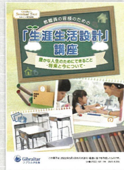
生涯生活設計講座 (約1時間)

老後収入の柱となる公的年金。その仕組みや給付内容、その他少子高齢化が進む中での今後の問題点などを説明します。