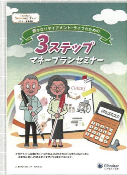
3ステップマネープランセミナー(約90分)

老後の主な収入となる公的年金制度の仕組みや給付内容等の説明。資産作り・運用で気をつけるべき事の説明や退職後のリスク等について説明します。